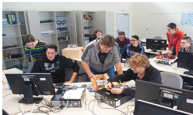
Realitätsnahe Ausbildung durch verschiedene Projekte der Trainingsfirma

In Zusammenarbeit mit den Berufsschulen Vilsbiburg, Dingolfing und Deggendorf ist es durch den Besuch von zusätzlichen Wahlfächern möglich, „nebenher“ auch die allgemeine Fachhochschulreife zu erwerben.